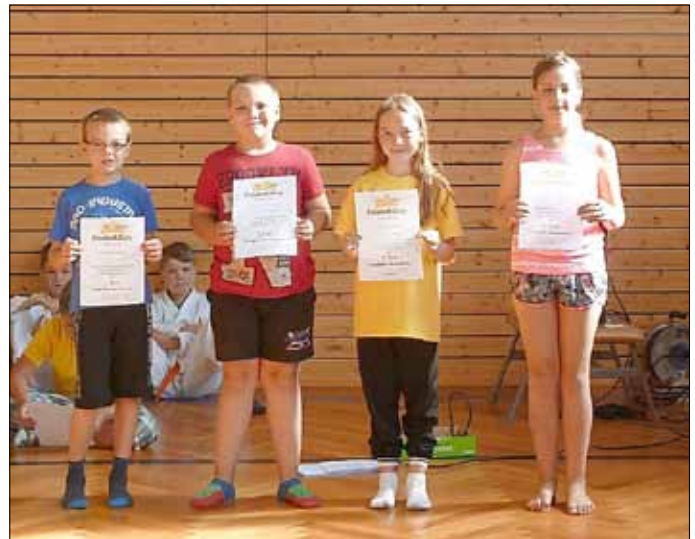
Nach einem Schuljahr freiwilliger Teilnahme an der Streitschlichterausbildung erhielten die entsprechenden Schüler eine Urkunde als Ernennung zum Streitschlichter der Grundschule "Pffifikus". Toll!