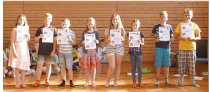
Zudem wurden die bestplatzierten Teilnehmer des Knobelkönigs der Region ausgezeichnet.

Danach erhielten aus jeder Klasse 2 Schüler eine Urkunde mit einem Lob, da sie sich in diesem Schuljahr auf einem bestimmten Gebiet besonders viel Mühe gaben.