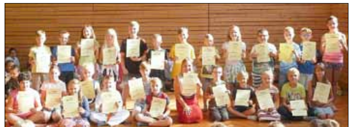
Anschließend verabschiedeten sich die 4. Klassen mit Auszügen aus ihrem großen Programm von der Grundschulzeit.